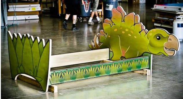
ساخت مصنوعات چوبی (تخت خواب کودک)