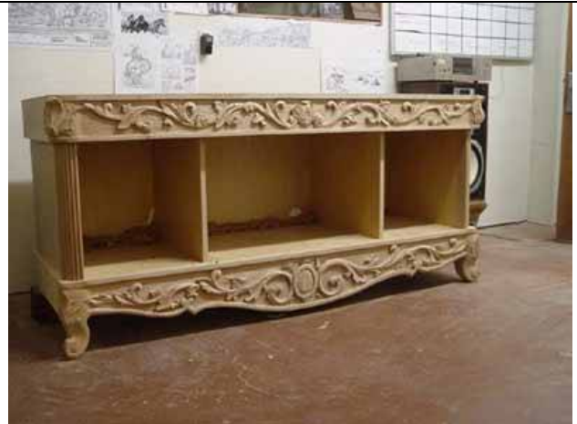
حکاکی چوب و ساخت عناصر تزئینی مبلمان منزل (بوفه)