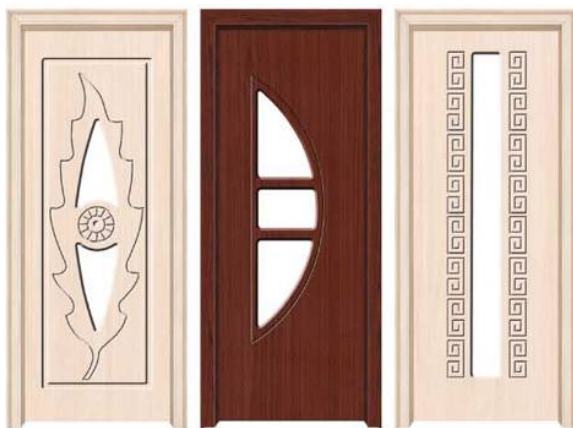
برش و حکاکی ام دی اف برای ساخت در