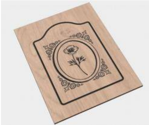
ساخت درهای کابینت