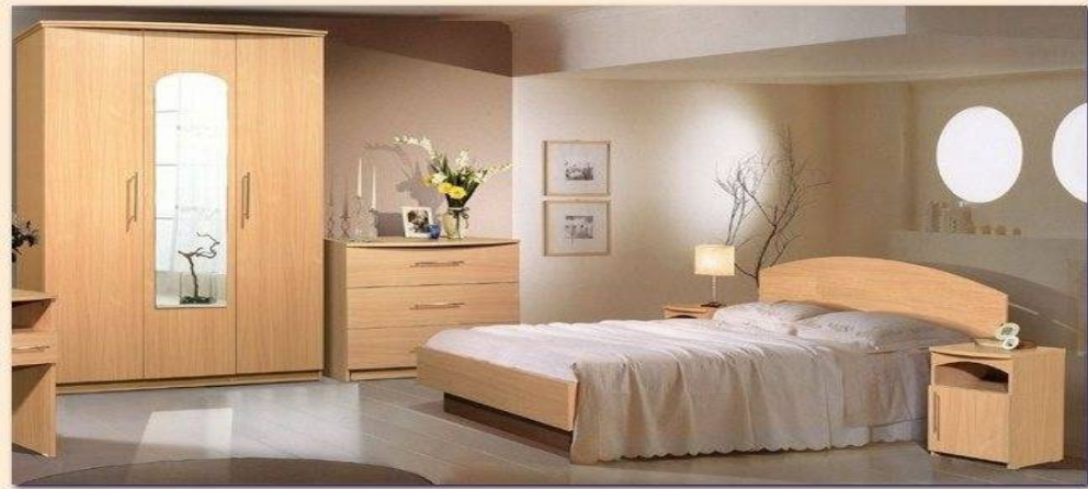
برش قطعات چوب و MDF برای ساخت مبلمان و دکوراسیون داخلی