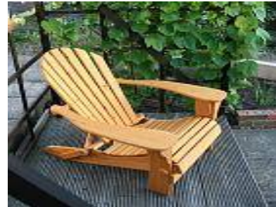
ساخت مصنوعات چوبی (نیمکت)