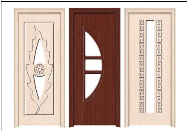
برش و حکاکی ام دی اف برای ساخت در