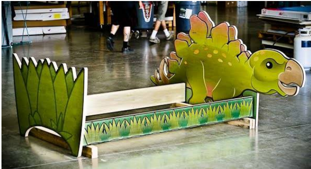
ساخت مصنوعات چوبی (تخت خواب کودک)