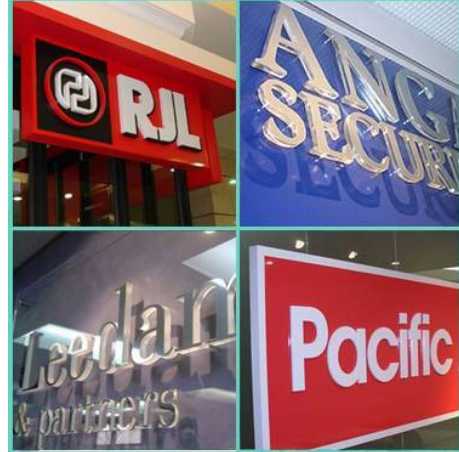
برش پلکسی گلاس و مواد دیگر برای ساخت تابلوهای بزرگ