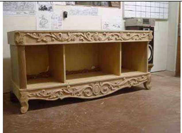
برش و حکاکی ام دی اف برای ساخت در