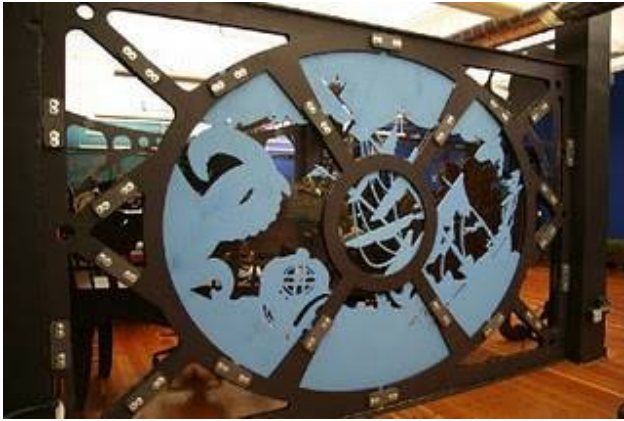
برش پلکسی گلاس و مواد دیگر برای ساخت تابلوهای بزرگ